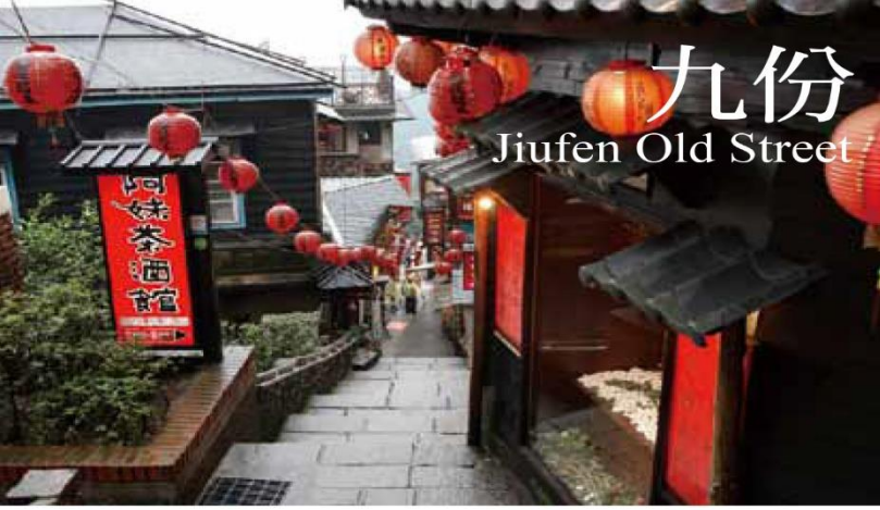
九份 Jiufen Old Street